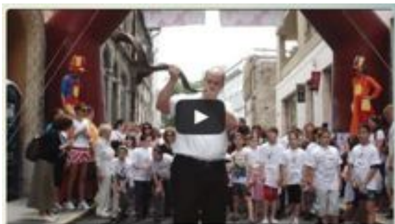
BUDAPEST, JUDAISM WITHOUT WALLS

Nous, les membres de la Communauté Libérale Bet Orim, sommes heureux de figurer sur 'Budapest, Judaism Without Walls' (le judaïsme hors les murs). Merci JDC !