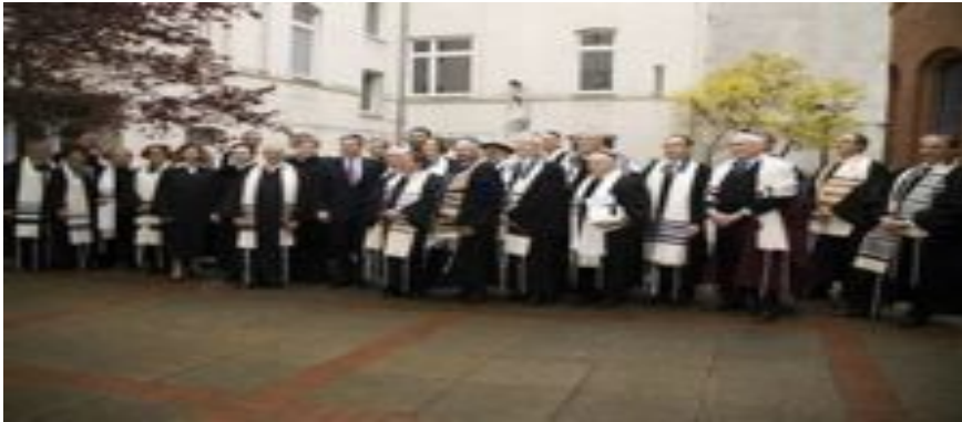
Kallah rabbinique 2011 à Varsovie