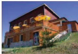
Dans le chalet des Alpagnes